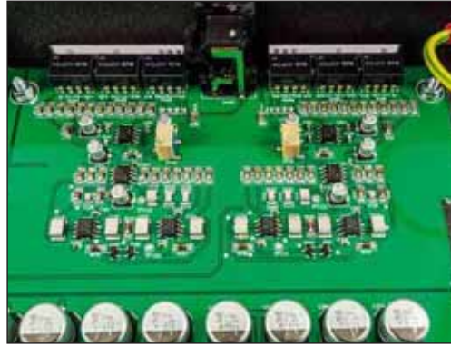
Links: Gleich acht Spannungsregelschaltungen kümmern sich um die Versorgung des Gerätes Rechts: Die Signalverarbeitung besorgen hochklassige integrierte Bausteine, hier die Eingangssektion

genau das ist es ja, wofür Electrocompaniet berühmt ist. Was bleibt, ist eine erkennbare Vorliebe für eine breite und ausufernde Abbildung, ansonsten aber ist das eine perfekt funktionierende Phonovorstufe ohne erkennbaren Charakter. Sie suchen einen bestimmten Sound? Den müssen Sie hiermit an anderer Stelle erzeugen. Die ECP 2 ist die pure Klangtreue – beeindruckend.