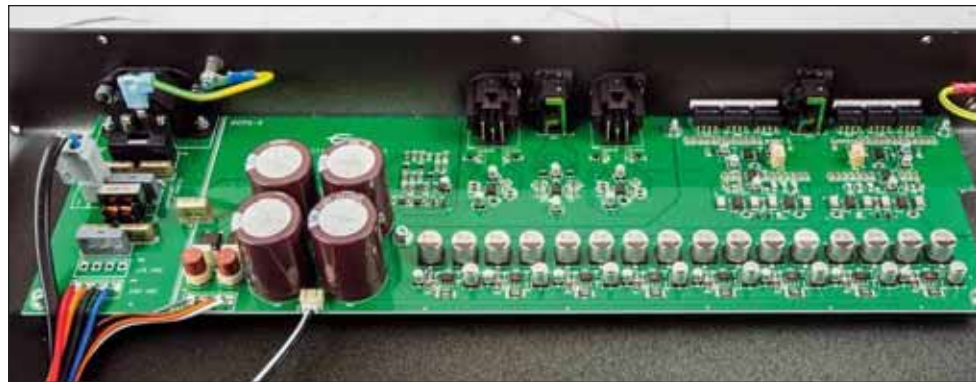
Links im Bild ist die Stromversorgung zu sehen. Mit auf der Platine befindet sich ein Netzfilter für den möglichst weit weg angeordneten Netztrafo